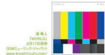
清 竜人 「WORLD」 2月17日発売 (EMIミュージック・ジャパン) www.kiyoshiryujin.com/

「WORLD」には、自問自答を繰り返しながらも必死で「世界」へ向けて「聞き手」へ向けて、(いつしか 必ず 誰もが 幸せに なるなんて言わないけど そう信じることで 必ず 未来は 変わるものだと思うから) (「がんばろう」と、誠実なメッセージを投げ掛ける彼の姿がある。人を信じるとか信じないとか、日々の生活の中ではそんな考えも失われてしまいう時代だが、だからこそ今、〈信じて欲しいんだよ〉(「痛いよ」という悲痛な声が必要だし、彼の歌には、そういう想いを人の心に真っすぐ届ける強烈な力がある。(堂前)