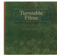
Turntable Films 「Parables of Fo-Fu」 発売中 (Second Royal Records) turntablefilms.com/

“良質な音楽”と、一言で済ませてしまうには惜しい。そんなバンドの登場だ。メンバー全員京都出身&在住とのことで、音楽性の根底にある“ゆるやかさ”みたいなものは、風土とも関係しているのかもしれない。音としては、アメリカン・ルーツ/インディー・ポップの匂いが多分に混じるけれど、何か日本人のツボを押さえているような箇所も多々あり、聴いていて非常に心地良い。それはきっと前提として、楽曲がしっかりしていること、メロディにあるポピュラリティには決して「ガサツさ」がないことかもあるのかな、と。(堂前)