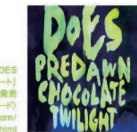
DOES 「夜明け前/チョコレート」 2月17日発売 (キューレコード) www.does-net.com/ index.html

贅肉の削ぎ落とされた武骨なロックを聴かせてくれるDOESが、3rdアルバム「The World's Edge」から約10ヶ月の沈黙を破り、ニュー・シングルを発売! 「夜明け前」は、次のステージへと向かう「希望」と、同時に生じる「迷い」が晴れるような情景を歌った歌詞が美しい、重厚なロック・ナンバーだ。両A面の「チョコレート」は、Mary'sシーク・ムーヴィー「トキョーチョコレート」主題歌で、柔らかな質感が温かい佳作。また、インディーズ期から高い人気を得ていた「薄明」を再録し、充実した1枚となっている。(岡田)